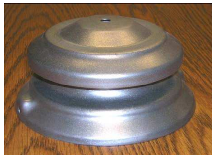
1. ábra Három darab, amelyet fémes zománccal vontak be.