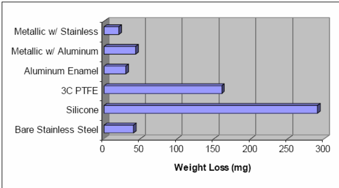
2. ábra Taber szerinti összehasonlító dörzsölési eredmények

ismételni a próbát a skálán, amíg olyan ceruzát találnak, amelyik nem vágja át a filmet, vagy a felületet legalább 3 mm távolságban megkarcolja.